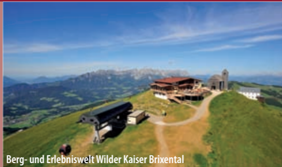
Berg- und Erlebniswelt Wilder Kaiser Brixental