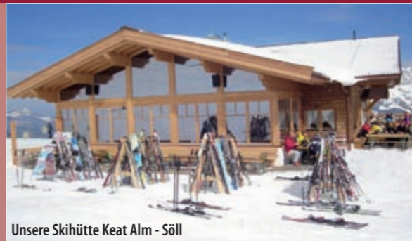
Unsere Skihütte Keat Alm - Söll